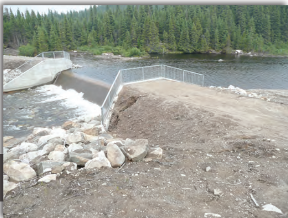
◀ Déversoir à seuil fixe