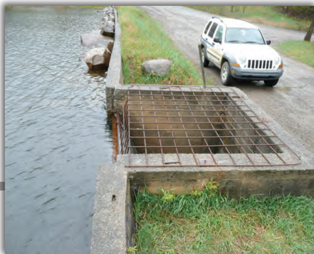
▲ Déversoir muni d'un grillage protecteur