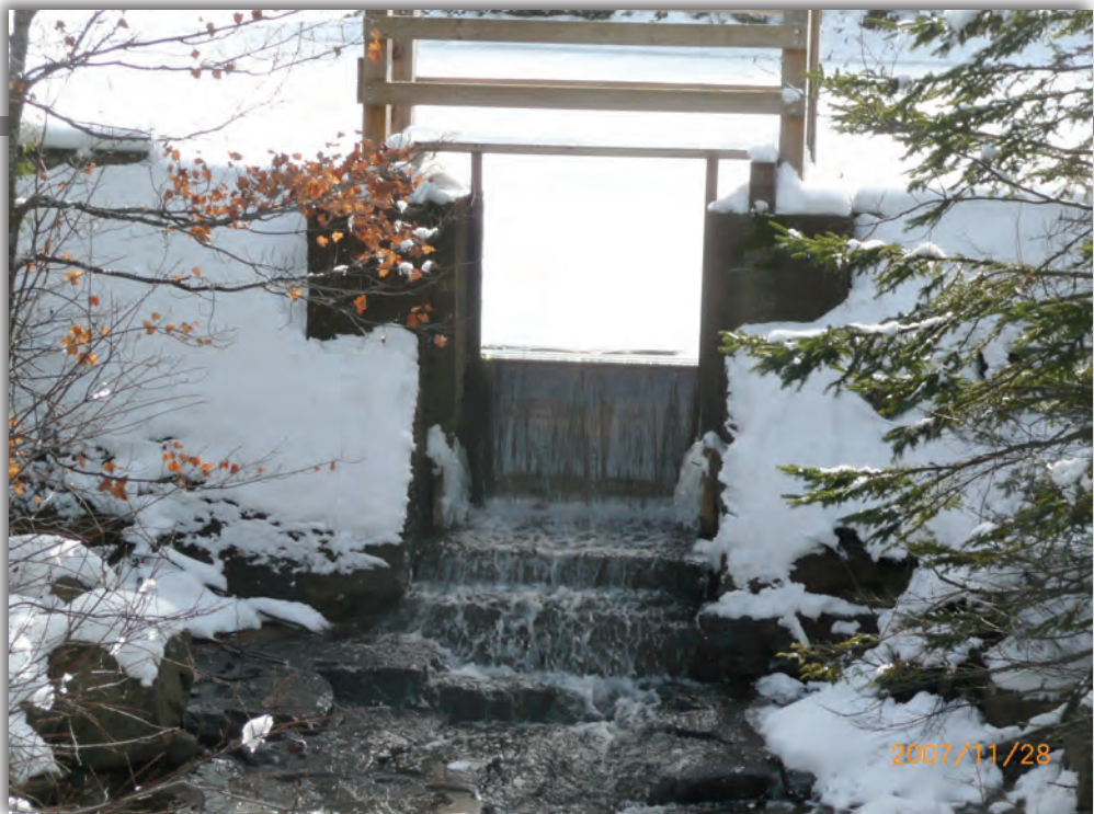
Déversoir sans mécanisme de levage ▼