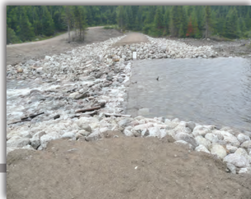
▼ Déversoir en enrochement