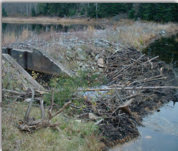
◀ Déversoir à risque d'obstruction