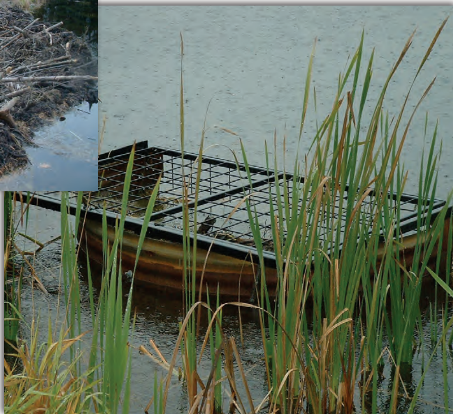
▼ Déversoir difficile d'accès